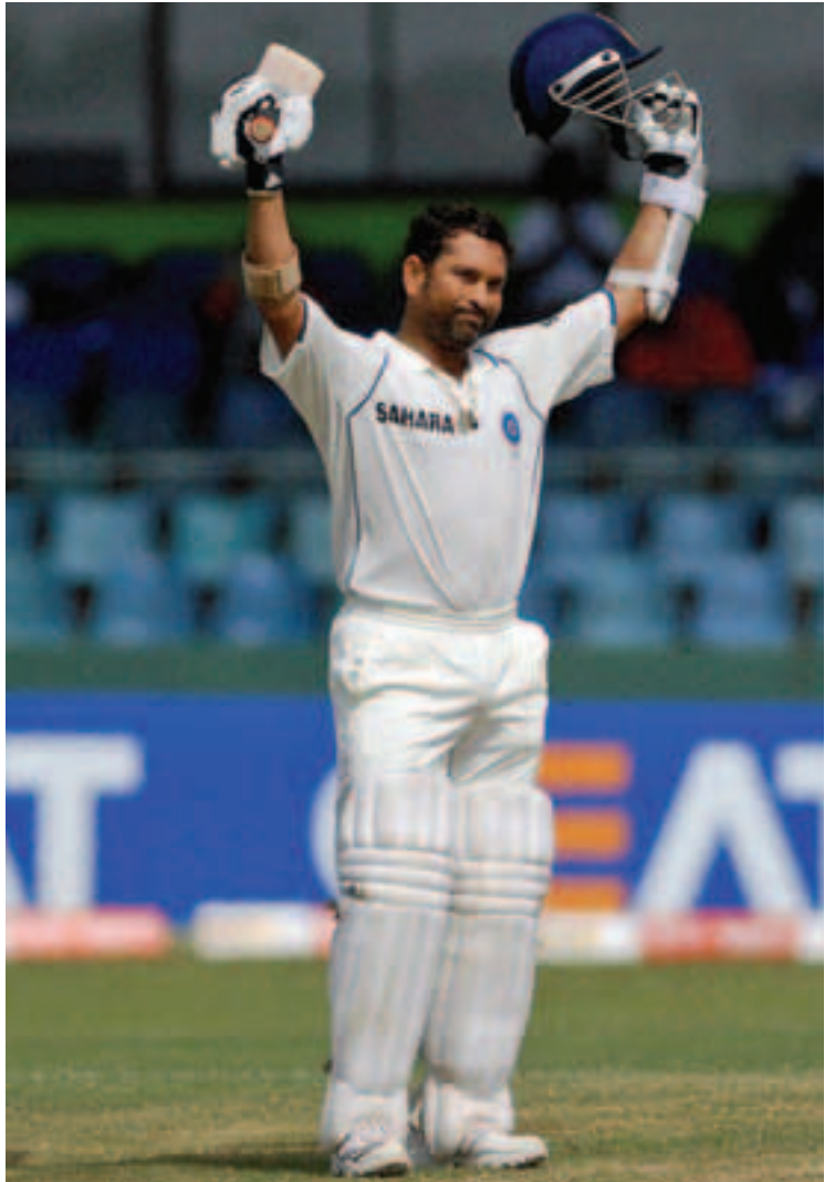
2006ൽ വെസ്റ്റ്ഇൻഡീസിനെതിരെ നാലു ടെസ്റ്റുകൾ. 2008-09ൽ ദക്ഷിണാഫ്രിക്കയ്ക്കെതിരെ രണ്ട് പാക്കിസ്ഥാനെതിരെ ഒരു ടെസ്റ്റിലും സച്ചിനു പുറമെ, കൂടുതൽ ടെസ്റ്റ് കളിച്ച മറ്റു ക്രിക്കറ്റ് താരങ്ങൾ: