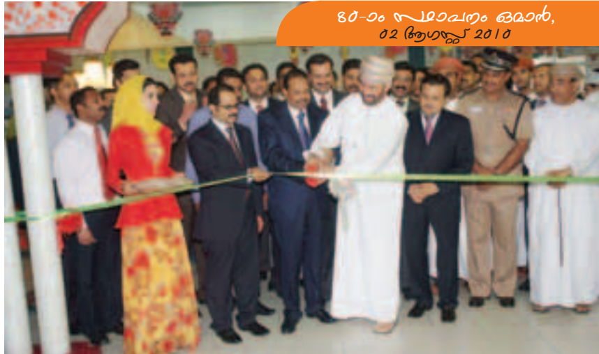
80-ാം വാർഷികം ഒമാൻ, 02 ഭൂഗസ്റ്റ് 2010

ലുലു ഹൈപർമാർക്കറ്റ് കുവൈത്ത് അൽ വഹ്ദാ മാൾ ശാഖ ഉദ്ഘാടനം ചെയ്ത ശേഷം എം.ഡി. എം.എ യൂസുഫലി അതിഥികൾക്കൊപ്പം