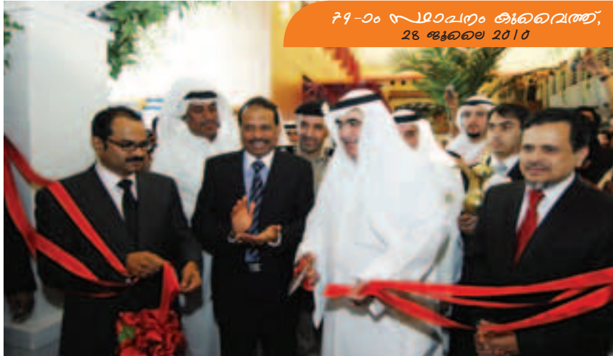
79-ാം വാർഷികം കുവൈത്ത്, 28 ജൂലൈ 2010