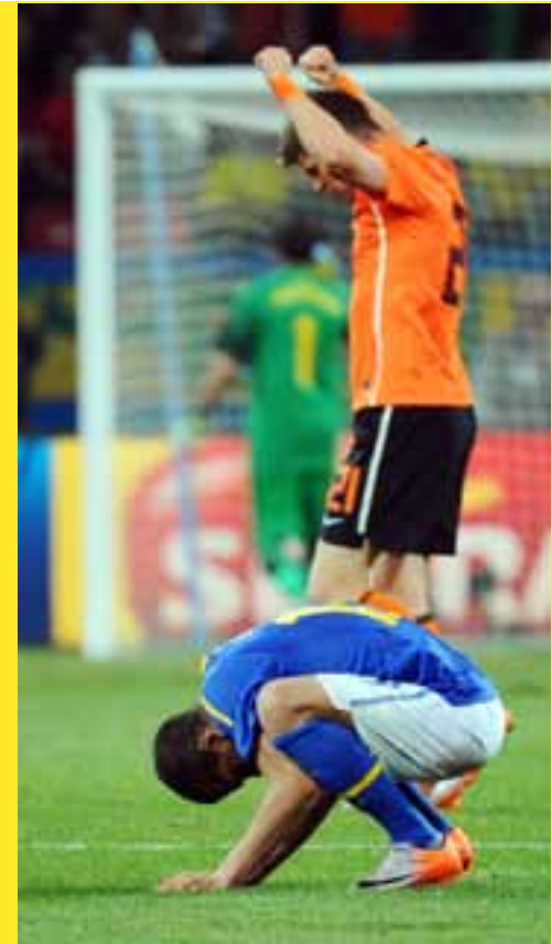
ബ്രസീൽ 2014 ഇൽ ഇറങ്ങുക. 12 മത്സര വേദികൾ ആണ് ബ്രസീൽ ഇതിനായി തയ്യാറാക്കുന്നത്. 2010 ലോകകപ്പിൽ സംഭവിച്ച ദുരന്തത്തിനു പകരം വീട്ടാൻ ബ്രസീലിനും അർജന്റീനക്കും സ്വന്തം നാട്ടിൽ നടക്കുന്ന വലിയ ടൂർണ്ണമെന്റുകളിൽ കഴിയും എന്നാണ് ആരാധകർ വിശ്വസിക്കുന്നത്.

മുതൽ 24 വരെ നടക്കുന്ന കോപ അമേരിക്ക ഫുട്ബോൾ ടൂർണ്ണമെന്റിൽ ആണ് ഇനി ബ്രസീലും അർജന്റീനയും ഒന്നിച്ചു അണിനിരക്കാൻ പോകുന്നത്. 12 ടീമുകൾ പങ്കെടുക്കുന്ന ടൂർണ്ണമെന്റിനു അർജന്റീന ആണ് ആതിഥ്യം വഹിക്കുന്നത്. ഇതിനായി എട്ടു മൈതാനങ്ങൾ അർജന്റീന ഫുട്ബോൾ അസോസിയേഷൻ തയ്യാറാക്കുകയും ചെയ്തു. 4 കിരീടങ്ങളുടെ ചരിത്രം പറയാൻ ഉടൻ കിലും അടുത്ത കാലത്തായി കോപ്പയിൽ അർജന്റീന മോശം ഫോമിൽ ആണ്. 1993 നു ശേഷം അവർക്ക് കിരീടം നേടാൻ കഴിഞ്ഞിട്ടില്ല. എന്നാൽ പരമ്പരാഗത വൈരികൾ ആയ ബ്രസീൽ 1993 നു ശേഷം നാല് തവണ കോപ കിരീടം ഉയർത്തിയിട്ടുണ്ട്. അവസാനം നടന്ന അഞ്ചിൽ നാലും ബ്രസീലാണ് വിജയിച്ചത്. 23 വർഷത്തിനു ശേഷം സ്വന്തം നാട്ടിൽ നടക്കുന്ന കോപ്പയിൽ കിരീടം നേടി എല്ലാ സങ്കടങ്ങളും കഴുകിക്കളയാനാണ് അർജന്റീന ഒരൂണുനേടുന്നത്. 2007 ഫൈനലിൽ ബ്രസീലിനോട് ഏറ്റുമുട്ടലിന്റെ തോൽവിക്കും അർജന്റീനക്ക് പകരം വീട്ടാനുണ്ട്. അർജന്റീന അടുത്ത വർഷത്തെ കോപ അമേരിക്ക ഉജ്ജ്വലമാക്കാൻ ഒരൂണുനേടാൻ 2014 ലോകകപ്പ് അവിസ്മരണീയമാക്കാനാണ് മഞ്ഞപ്പട ഒരൂണുനേടുന്നത്. 2002 നു ശേഷം ലോകകപ്പിൽ കാര്യമായ നേട്ടം കൊയ്യാൻ ബ്രസീലിനു കഴിഞ്ഞിട്ടില്ല. 1950 ലോകകപ്പിനു ആതിഥ്യം വഹിച്ചിരുന്നെങ്കിലും ഫൈനലിൽ ഉറുഗ്വെയോട് 'മറക്കാന' ദുരന്തം സംഭവിച്ചത് ബ്രസീലിനെ ഇന്നും നടുക്കുന്ന ഓർമ്മയാണ്. 60 വർഷമായി കൊട്ടി നടക്കുന്ന ഈ വേദന സ്വന്തം മണ്ണിൽ കഴുകിക്കളയാനാണ്